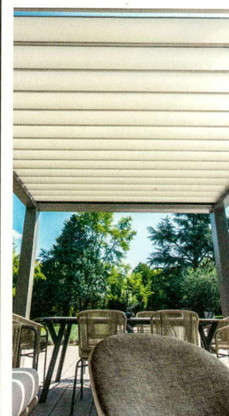
Pergola bioclimatica in alluminio “Prestige Collection” BT GROUP.