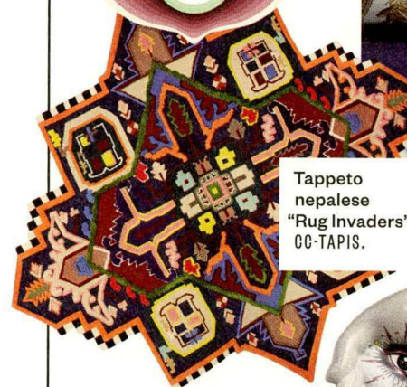
Tappeto nepalese “Rug Invaders” CO-TAPIS.