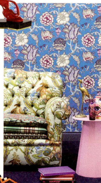
Tessuti e carte da parati floreali BRAQUENIÉ.