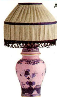
Lampada “Oriente Italiano” RICHARD GINORI 880 euro.