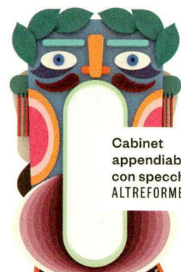
Cabinet appendiabiti con specchio ALTREFORME.