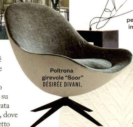
Poltrona girevole “Soor” DESIRÉE DIVANI.