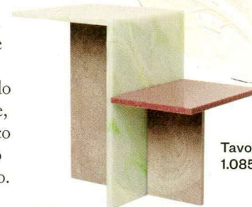
Tavolino FERM LIVING 1.085 euro.